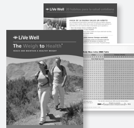
Control del peso