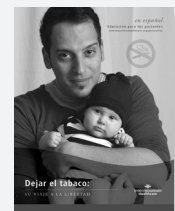
Dejar de Fumar