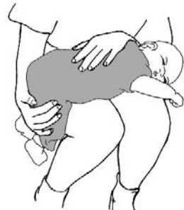
Bebé doblado sobre los muslos