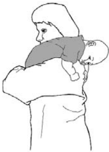
Bebé doblado sobre el hombro