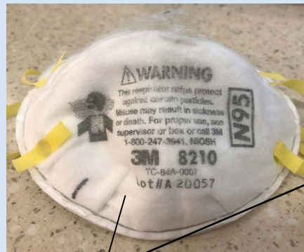
No tiene forma