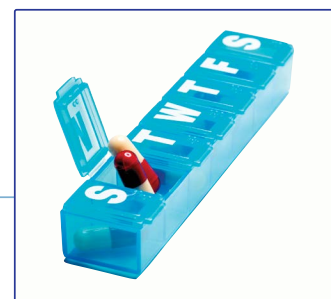
Tabla de dosificación diaria de muestra