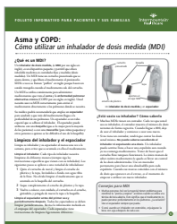
Asthma: How to Use a Metered Dose Inhaler (Asma y COPD: cómo utilizar un inhalador de dosis medida)