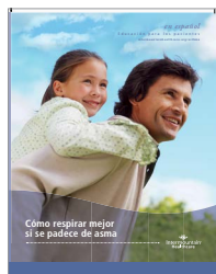
Breathing Easier with Asthma (Cómo respirar mejor si padece de asma)