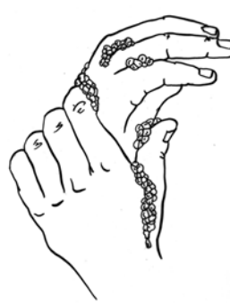
fróteselas durante 10 a 15 segundos